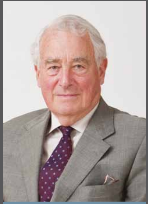
السير أنطوني إيفانس

«نحن نعمل بجد ونبقى مستعدين لتوفير قضاء يتسم بالخبرة والاستقلالية والسرعة لكل الأطراف التي تدخل منازعاتها ضمن الاختصاص القضائي للجنة.»